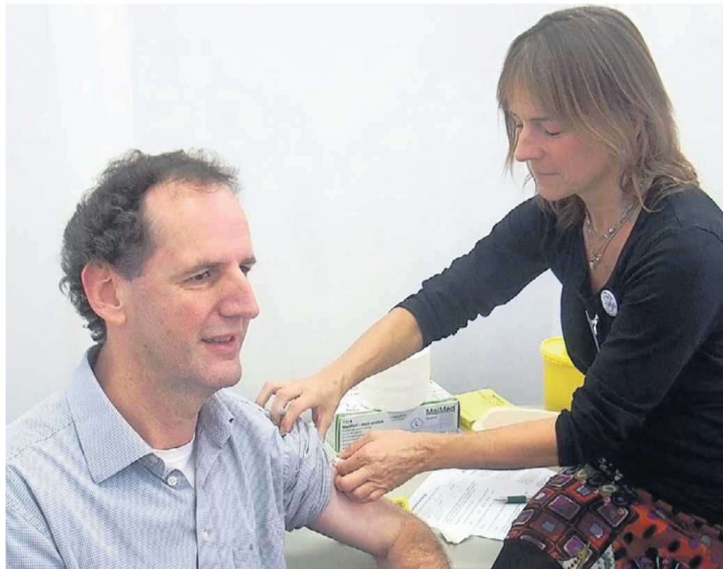
Zum Abschluss der Aktion „Grippefreier Landkreis“ ließen sich im Marburger Kaufhaus Ahrens zahlreiche Menschen gegen Influenza impfen.

Marburg. Vielfältige Therapiemöglichkeiten bei den verschiedenen Formen der Arthrose sind Thema der Veranstaltungsreihe „Fragen Sie Ihren Arzt und Apotheker“.